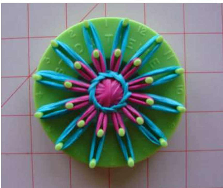
Zakończony ściąg ukośny.