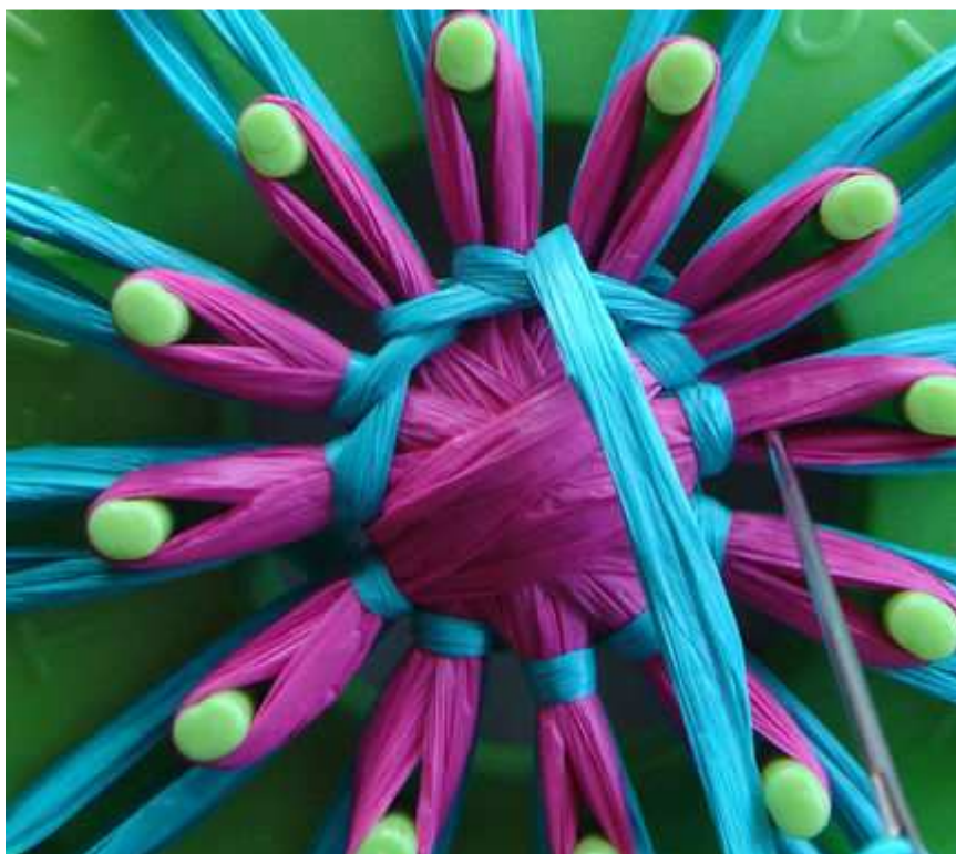
Szczegóły ściegu ukośnego.

Powtórz całą drogę i zakończ ostatni ściąg przyciągając materiał pod pierwszym skosem, żeby stworzyć wygląd ciągły.