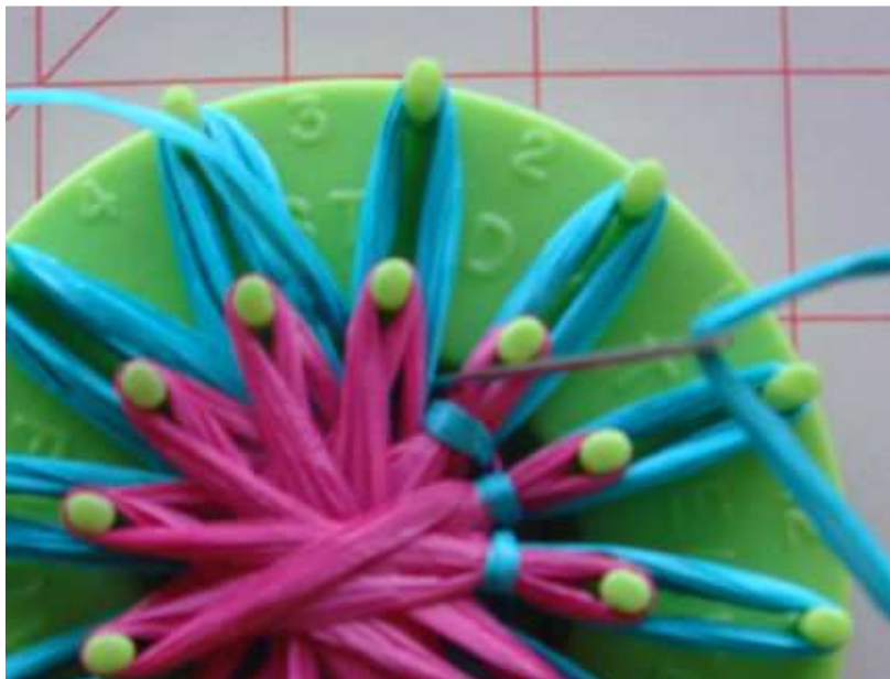
Szczegóły ściegu wstecznego.

w dół przez odstępek 12, w górę do odstępu 1 i w dół do odstępu 12, w górę do odstępu 2 i w dół do odstępu 1, w górę do odstępu 3 i w dół do odstępu 2, i tak dalej aż się przejdzie całą drogę naokoło. Upewnij się, że przeciągasz materiał pomiędzy płatkami i nie przekłuwasz materiału.