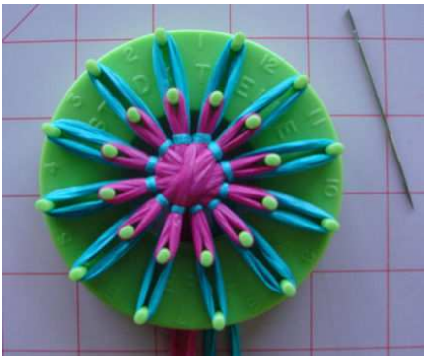
Zakończony ścieg wsteczny